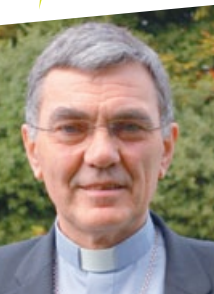
+ Denis Moutel évêque de Saint-Brieuc et Tréguier

Dans la dernière étape du synode, nous voulons regarder également la réalité de nos communautés chrétiennes. Avec qui et avec quels moyens pourrons-nous mettre en œuvre les orientations du synode? Dans quels lieux et avec quelles personnes pourrons-nous recevoir et transmettre à d'autres la joie de l'Évangile? Quelle forme pourront prendre nos paroisses et communautés pour qu'elles soient porteuses de la joie de l'Évangile? Que devons-nous laisser? Que devons-nous choisir en priorité? Que pourrons-nous mieux vivre ensemble? Entre prêtres, diacres et laïcs, entre paroisses d'un même territoire, entre générations, sans oublier de rejoindre ceux qui ne connaissent pas le Christ.